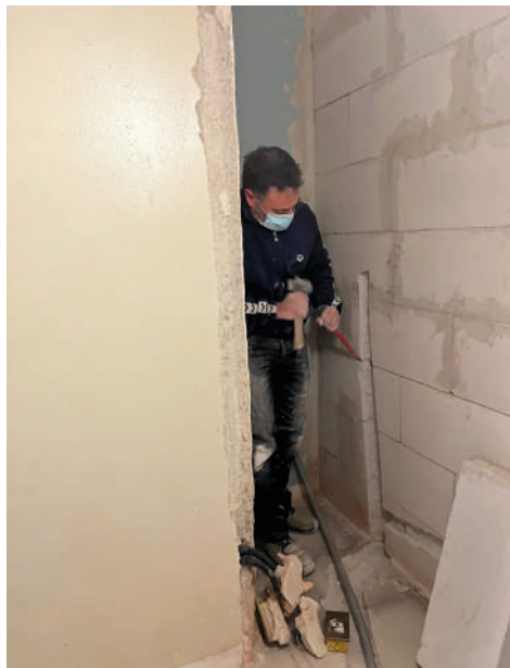
Ristrutturazione in corso a Casa Ail La Coccinella