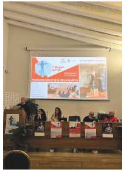
Uno degli incontri "I martedì dell'Ail"

evitando soluzioni definitive. Abbiamo ripreso a gennaio con un bellissimo incontro sull'attività fisica fondamentale per la mente oltre che per il corpo. Le attività di cui abbiamo parlato, e da cui tutti possono trarre beneficio, sono due: una abbastanza famosa, il Pilates, di cui si conoscono da tempo i benefici, e una relativamente nuova, il Nordic walking, una sorta di passeggiata all'aperto aiutata da bastoni. In realtà il movimento, anche solo una semplice passeggiata quotidiana, ha degli effetti miracolosi sul nostro corpo e sul nostro umore, dunque il consiglio è quello di non cedere alla pigrizia e di ritagliarci ogni giorno uno spazio dedicato all'attività fisica. Febbraio ha visto avvicinarsi sul nostro palco, gli esperti dell'alimentazione. Inutile ribadire quanto una corretta dieta ci aiuti a star bene; oggi l'attenzione a ciò che mangiamo si è fatta altissima, sappiamo che esistono alimenti che vanno evitati con cura e altri che vanno limitati, non va poi trascurato il modo in cui si cucinano i vari tipi di cibo. Tempi e modi di cottura possono rendere più sani i no-