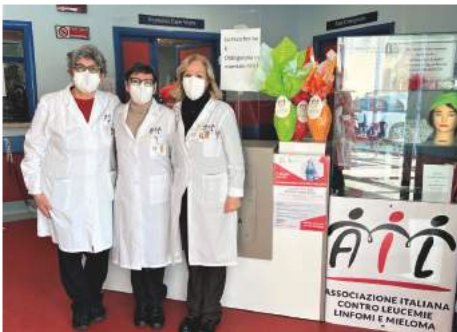
Grazie alle uova di Pasqua dell'Ail è possibile contribuire alla ricerca sui tumori del sangue

Abbiamo messo a disposizione i numeri 091/6883145, 091/7726778, e la mail info@ailpalermo.it , per chiedere informazioni su come condividere le nostre iniziative e proporre la propria candidatura e diventare sostenitori della nostra missione, per poter scegliere insieme la modalità migliore per sostenere la ricerca e i servizi ai pazienti oncoematologici. Saranno inoltre disponibili tutti i