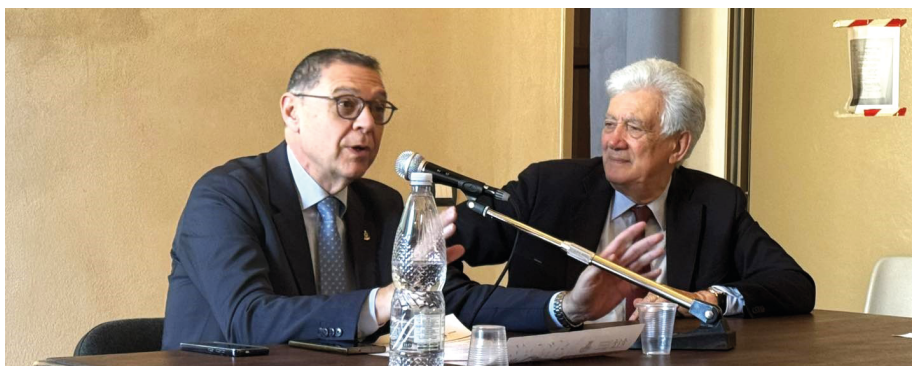
Un momento dell'incontro “Diamo voce alla cura” a Castelvetroano

Il 24 aprile scorso, al Collegio dei Minimi a Castelvetroano, Ail Palermo-Trapani e l'Uosd di Ematologia dell'Ospedale di Castelvetroano hanno organizzato un incontro per illustrare ai tanti pazienti presenti e al pubblico intervenuto le applicazioni pratiche di questi progressi scientifici e la possibilità di fruirne anche nei Centri ematologici di primo livello, quale l'Uosd di Ematologia di Castelvetroano, attraverso la Rete ema-