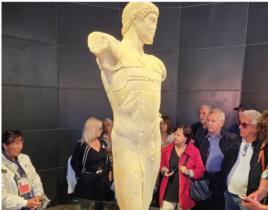
La visita a Mothia dei volontari di Ail Palermo