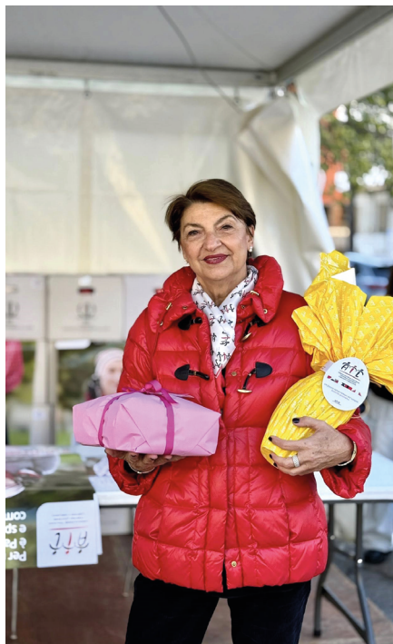
Volontari in piazza con le uova e le colombe

“ P er me quest’uovo è Pasqua, Ferragosto e spero tantissimi compleanni”. È questo il messaggio che continua ad accompagnare la campagna di Pasqua di Ail Palermo-Trapani, simbolo di speranza, vicinanza ai pazienti e sostegno concreto alla ricerca scientifica contro i tumori del sangue. Anche nel 2026 la risposta del territorio è stata straordinaria. In un contesto in cui le occasioni di solidarietà sono sempre più numerose, i sostenitori Ail hanno rinnovato con entusiasmo il loro impegno accanto all’associazione, confermando fiducia e partecipazione verso le attività dedicate ai pazienti ematologici e alle loro famiglie. La campagna ha coinvolto oltre 170 punti di distribuzione nelle province di Palermo e Trapani, grazie alla presenza instancabile dei volontari, veri protagonisti di questa grande rete solidale. Accanto a loro hanno partecipato scuole, istituzioni, Comuni, aziende ed esercizi commerciali che hanno scelto di sostenere la missione di Ail Palermo-Trapani e contribuire alla diffusione di un messaggio di