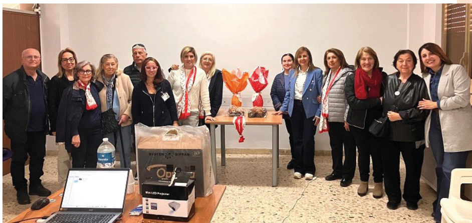
Al Centro polivalente Rita Atria di Casa Santa a Erice l'incontro organizzato da Ail

Il pomeriggio è stato dedicato alla presentazione dei servizi che Ail offre sul territorio. Tra questi il centro di ascolto, dove volontari appositamente formati forniscono informazioni sui diritti dei pazienti e sui servizi: dal servizio navetta alle case Ail, dal supporto nutrizionale alla cura della persona, fino all'utilizzo della nuova app "AILY". Il servizio è attivo telefonicamente al numero 348-1835629 dal lunedì al venerdì, dalle 9 alle 13 e dalle 15 alle 18, oppure tramite mail all'indirizzo segreteria.ailtp@gmail.com . Si riceve, inoltre, su appuntamento al Centro Rita Atria, in via Romsini 15-Casa Santa Erice, il lunedì dalle 10 alle 12 e il mercoledì dalle 16 alle 18. Numerose le iniziative programmate dalla sede di Trapani, fra cui il torneo di burraco SolidAil, i tornei di padel e calcio a 5. In estate, invece, torna uno degli appuntamenti più attesi: l'AperAil. Non meno importanti le bomboniere solidali, che trasformano momenti speciali in occasioni concrete per sostenere la ricerca. Antonella Ricevuto